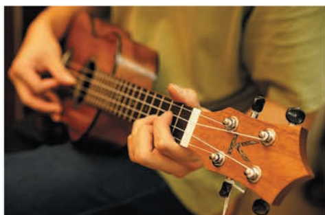
最後に弾きながら、全体を通して検品します。