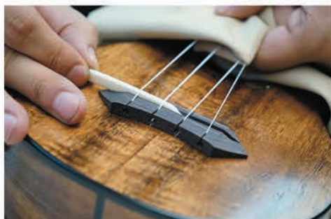
サドルの高さや形状を調整します。