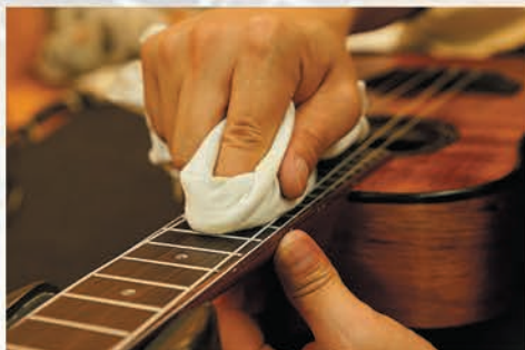
指板を家具用特殊オイルで仕上げます。