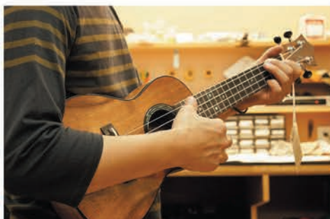
さらにもう一度、最終チェック後に出荷となります。