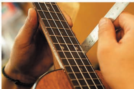
弦と指板のすきまが適正かチェックします。