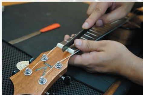
チューニングや弦の鳴りに重要なナットの弦溝を調整。

さらにお店に出荷される前に一本ずつ丁寧に調整を行います。KUMUウクレレJapanのプロダクトスペシャリストが細部に渡ってしっかりと品質をチェックしますので、初めて使用する時から弾きやすさ抜群です。